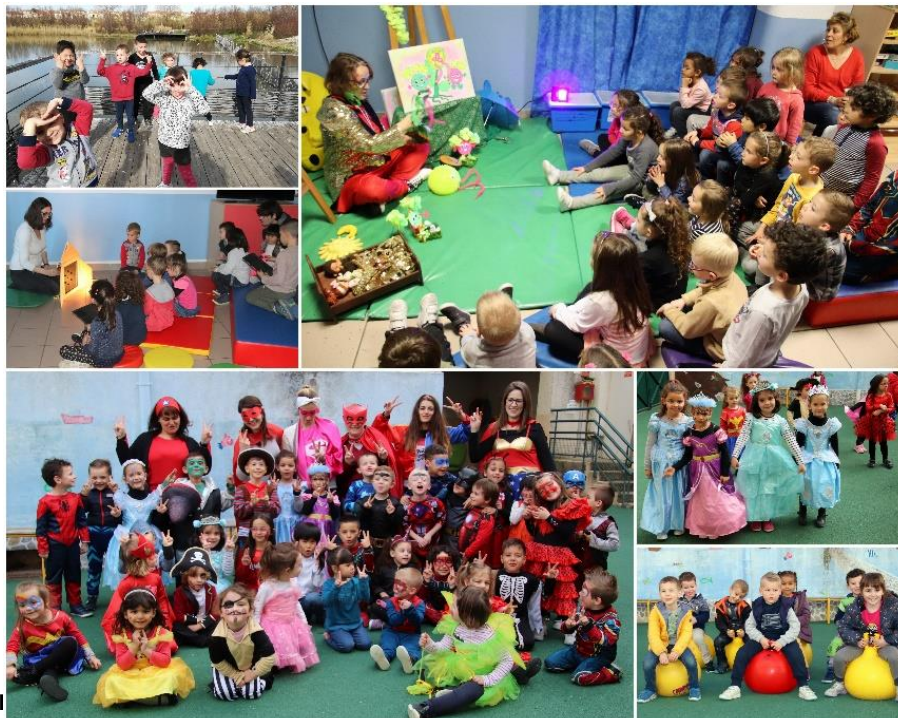
L'accueil des en